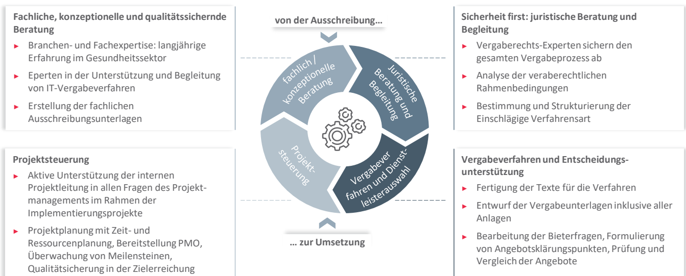
Abbildung 2: 360-Grad-Beratungsansatz – Fachexperten und Juristen sichern Ihre Förderthemen ab

Wir begleiten Sie ganzheitlich: von der Anforderungserfassung über die Ausschreibungsbegleitung und Dienstleistungsauswahl bis hin zum erfolgreichen Projektabschluss. Damit sind die Sicherheit und Qualität, die Sie im Umfeld der problematischen Marktsituation und den regulatorischen Besonderheiten des Vergabe- und Förderrechts auf dem Weg in eine digitale Klinikzukunft benötigen, garantiert. Im Fokus steht die Priorisierung der Versorgung und Pflege – davon profitieren sowohl Ihre Patientinnen und Patienten als auch Ihr klinisches Fachpersonal.